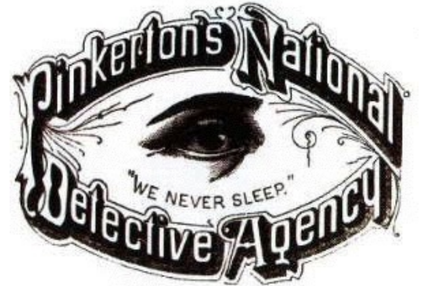
Logo und Claim Pinkerton Detective Agency, ca. 1850