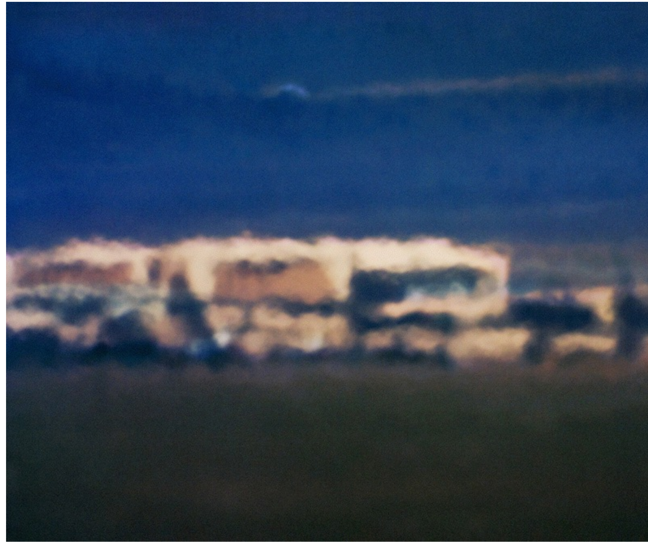
Trevor Paglen: Open Hangar, Cactus Flats, NV, Distance ~ 18 miles, 10:04 a.m C-Print 30 x 36 inches 2007