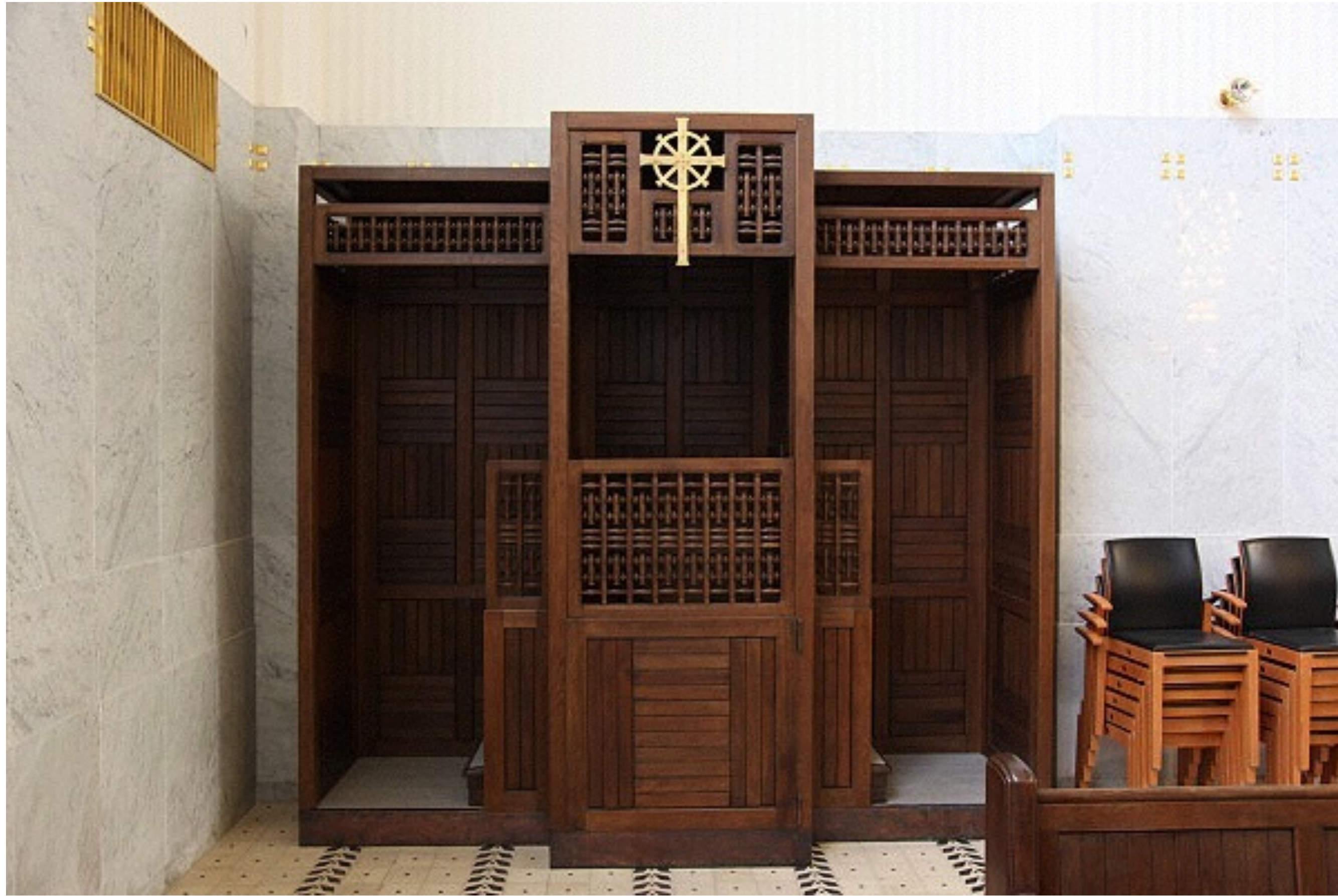
Beichtstuhl, Kirche zum heiligen Leopold, Wien