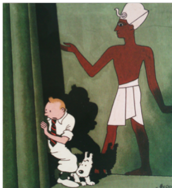
Georges Remi: Les Cigares du Pharaon, 1934