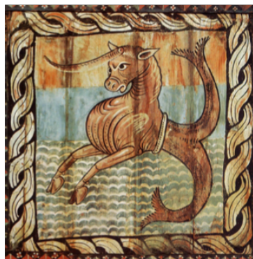
Zillis: Einhorn mit Fischschwanz. Bilderdecke Kirche St. Martin, um 1130